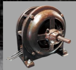
国産初 5馬力モータ

1910年、久原鉱業所日立鉱山付属の機械修理工場として、茨城県日立市にて創業（1920年に会社組織として設立）