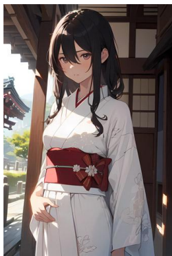
パブリックドメイン Q: 著作権フリー画像素材集